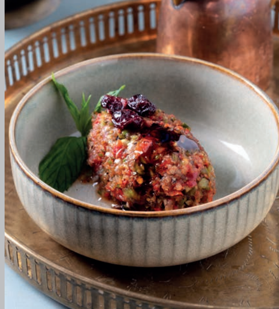
Acılı Ezme 475 ₺

Közlenmiş patlıcan, limon suyu, sarımsak. Süt ve Ürünleri (Süzme Yoğurt)