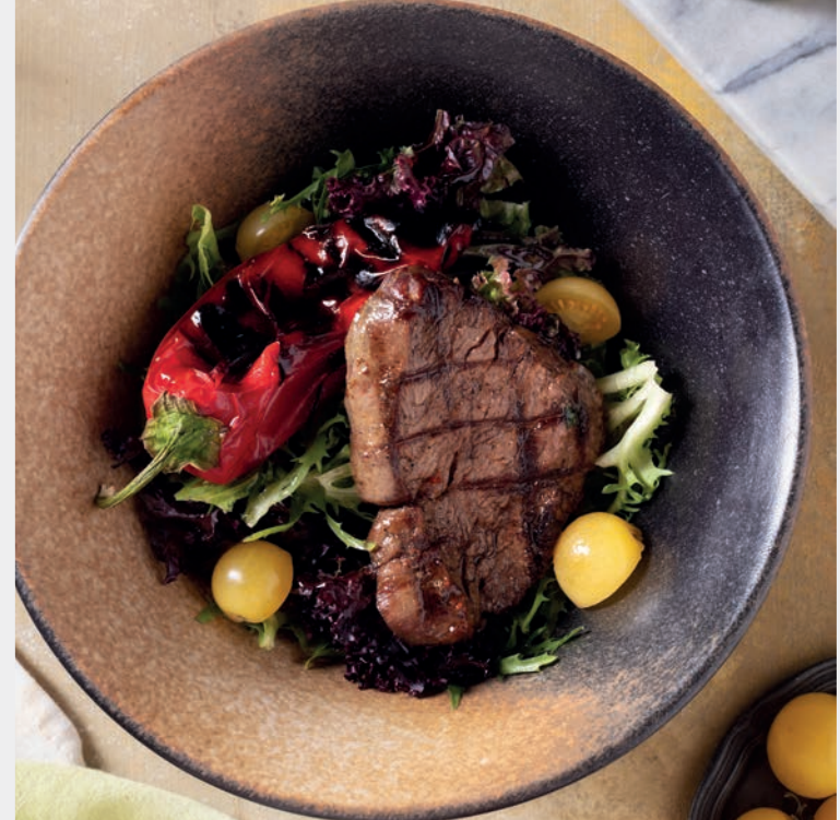
Köz Biberli Lokum Bonfile Salatası 1.750 ₺

Akdeniz yeşillikleri, közlenmiş kapyra biber, lokum bonfile, kruton ekmek, parmesan peyniri.