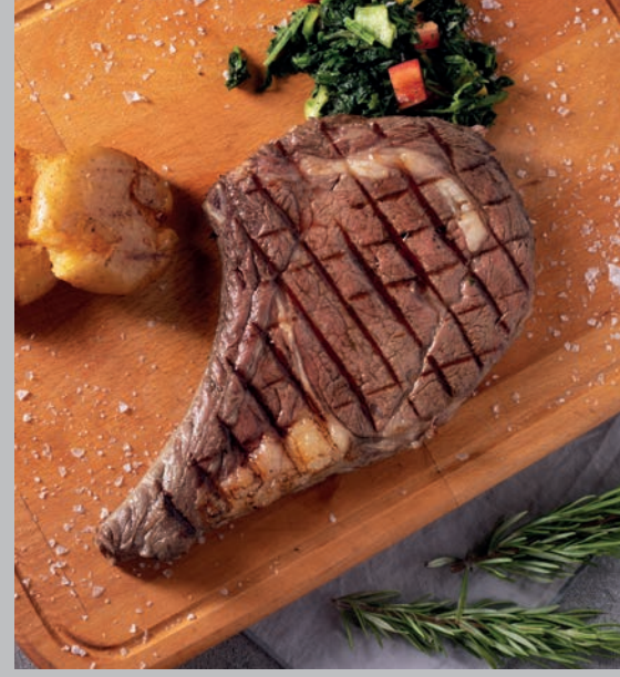
Dana Pirzola 2.900 ₺

Taş fırında geleneksel yöntemle pişirilen baharatlı pilavlı kuzu eti. Süt ve Süt Ürünleri (Tereyağı), Gluten 220 gr.