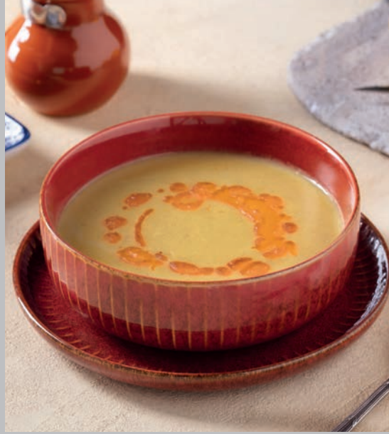
Mercimek Çorbası 510 ₺

Mercimek çorbası, yanına bir dilim limon, üzerine tereyağlı hafif acı sos ile servis edilir. Süt ve ürünleri (Tereyağı)