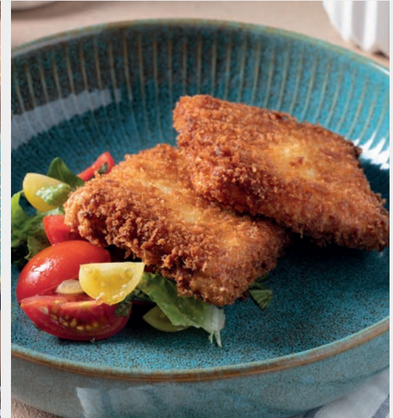
Pane Hellim Kızartması 1.100 ₺ Çıtır ekmek ile panelenmiş hellim peyniri Gluten (Ekmek) Süt ürünleri (Peynir)

Coğrafi işaretli ürünler kullanılmaktadır. Alerjenler menü içeriğinde belirtilmiştir. Servis elemanlarımızdan bilgi alabilirsiniz. "Yemeğinizi daha iyi hazırlayabilmemiz için lütfen diyet gereksinimlerinizi ve alerjilerinizi bize bildirin." Tüm fiyatlar Türk Lirası (TL) cinsindedir.