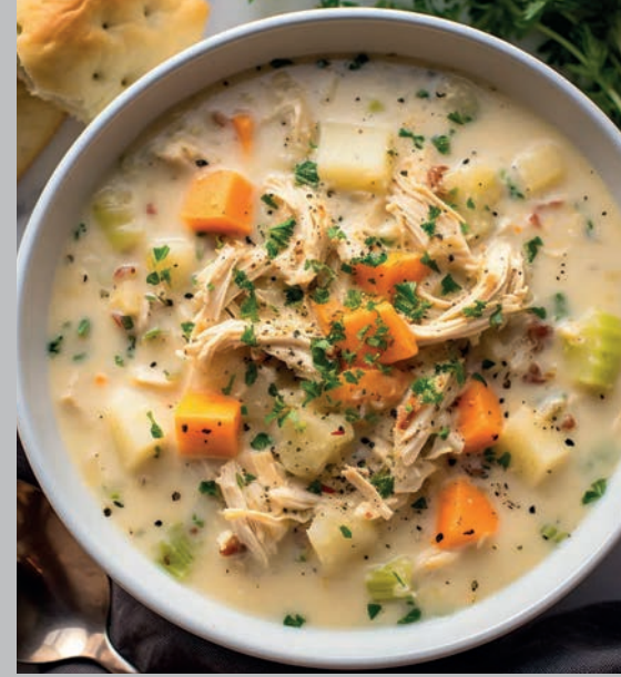
Tavuk Çorbası 650 ₺

Mercimek çorbası, yanına bir dilim limon, üzerine tereyağlı hafif acı sos ile servis edilir. Süt ve ürünleri (Tereyağı)