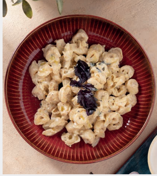
Reyhan Soslu Kremalı Tortellini 1.090 ₺ Gluten, Süt ve ürünleri (Krema)