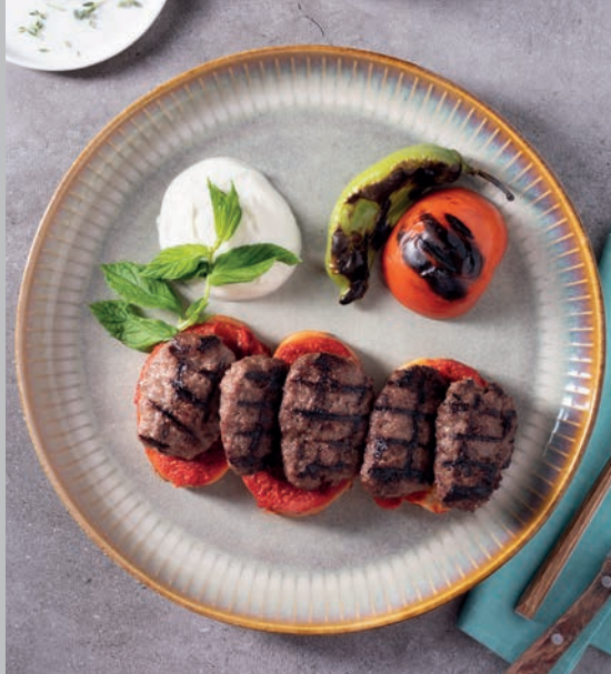
Islak Köfte 1.200 ₺

Kremalı ıspanak sote ve fırınlanmış patates ile servis edilir. (Dana etine alternatif sunulmuştur.) Süt Ürünleri.