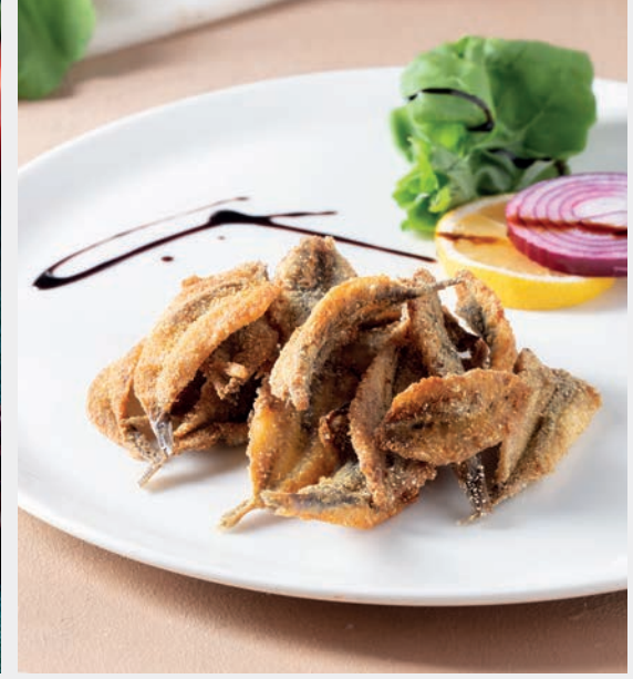
Çıtır Hamsi (sezonluktur) 980 ₺ Panelenip kızartılmış hamsi, roka ve soğan ile servis edilir. Gluten (Un)