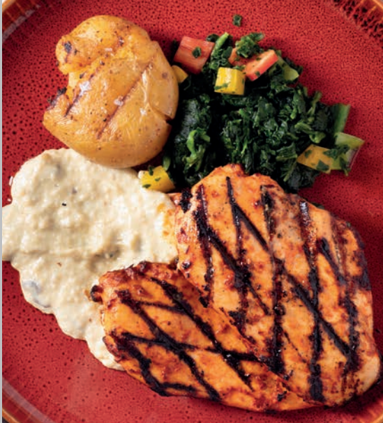
Tavuk Göğüs Izgara 1.300 ₺

Kremalı ıspanak sote ve fırınlanmış patates ile servis edilir. (Dana etine alternatif sunulmuştur.) Süt Ürünleri.