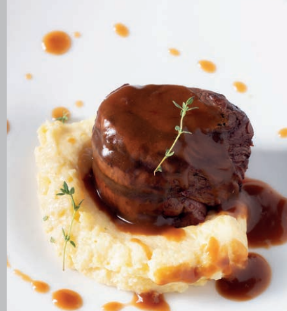
Demi Glace Soslu Fileminyon 2.750 ₺

Izgara köfte, domates soslu ekmek, ızgara sebze ve yoğurt ile servis edilir. Gluten, Süt ve Süt Ürünleri (Yoğurt)