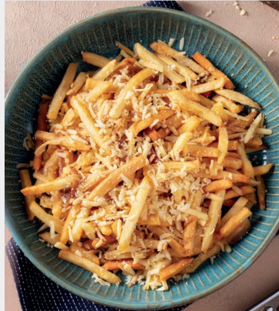
İsli Çerkez ve Parmesan Rendeli Patates Kızartması 750 ₺ Süt ve Ürünleri (Peynir)