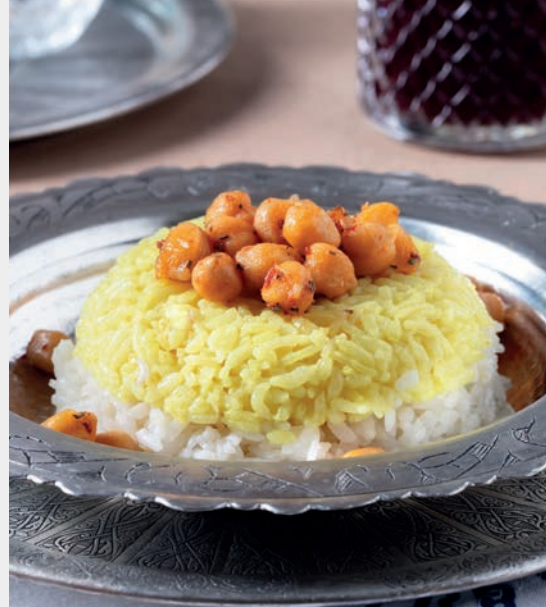
Dane-i Sari 730 ₺ Nohutlu ve safranlı pilav. Gluten içerir.