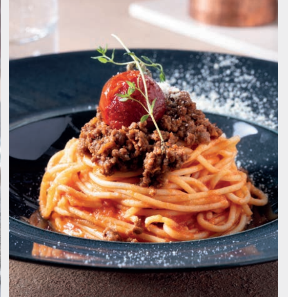
Spagetti Bolonez 1.250 ₺ İnce kıyma et, fesleğen ve parmesan peynirli makarna. Gluten, Süt ve ürünleri (Tereyağı) 100 gr.