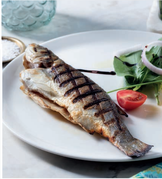
Izgara Levrek 1.500 ₺

Kömür ızgarada pişirilmiş mevsim yeşillikleri ile ızgara balık. (1000 gr. deniz levreği kullanılmıştır.)