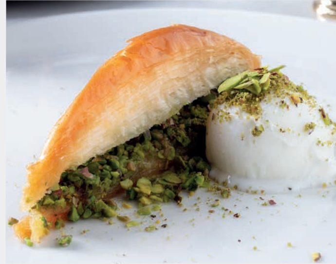
Baklava 970 ₺ Mermer tezgâhta açılmış ince yufkaların arasında kat kat lezzetler serpilir. Bol tereyağı ile pişirilen baklavaya hazırlanan şerbet dökülür. Keçi sütünden dondurma ile sunulur. Gluten, Süt ve ürünleri, Sert kabuklu Meyveler, Yumurta