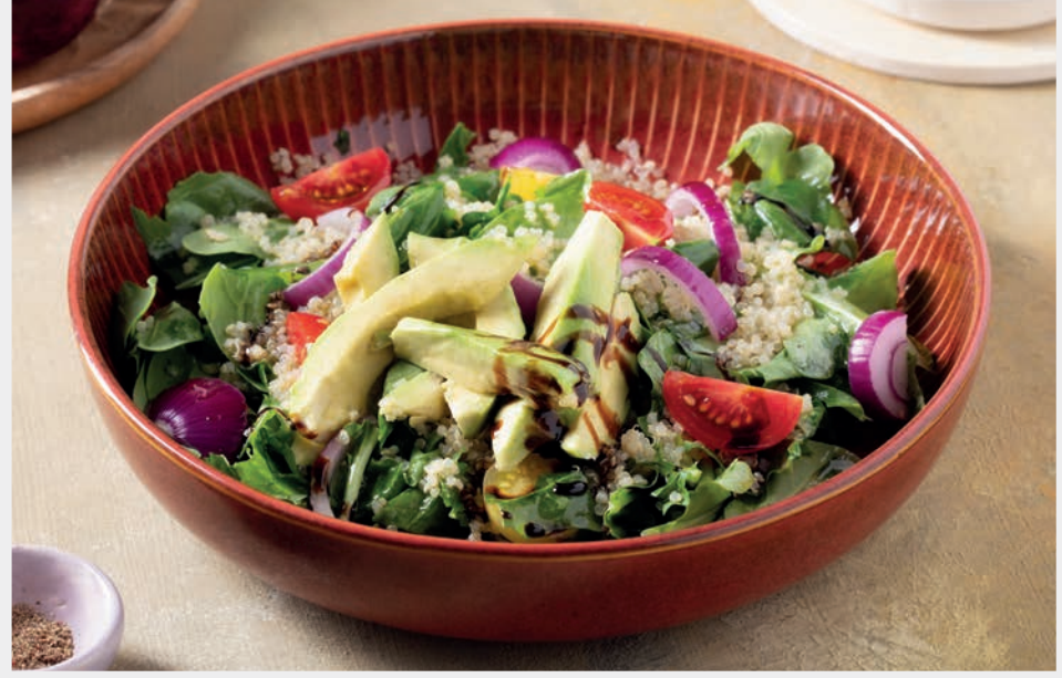
Avokadolu Kinoa Salatası 1.200 ₺

Akdeniz yeşillikleri, yeşil elma, ton balığı