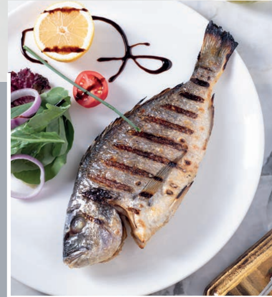
Izgara Çupra 1.500 ₺

Kömür ızgarada pişirilmiş mevsim yeşillikleri ile ızgara balık. Kabuklu Deniz Ürünü, Süt ve Süt Ürünleri (Tereyağı) 220 gr