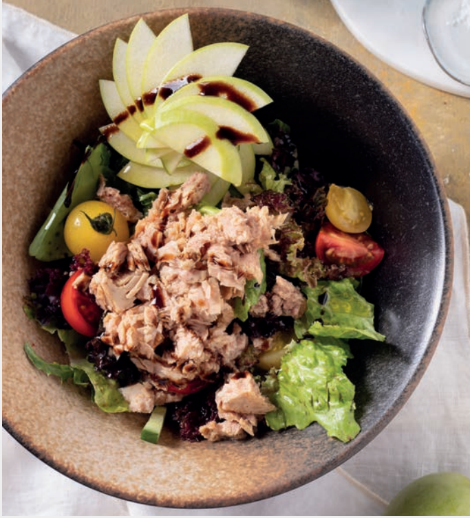
Yeşil Elmalı Ton Balıklı Salata 1.100 ₺

Akdeniz yeşillikleri, yeşil elma, ton balığı