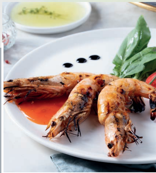
Izgarada Jumbo Karides 2.900 ₺

Kömür ızgarada pişirilmiş mevsim yeşillikleri ile ızgara balık.