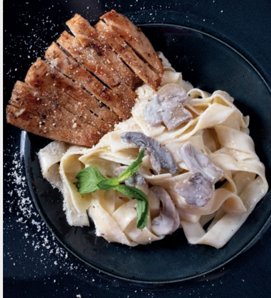
Tavuklu Fettucini 1.450 ₺ Mantar, sebze ve kremalı makarna. Gluten, Süt ve ürünleri (Tereyağı)