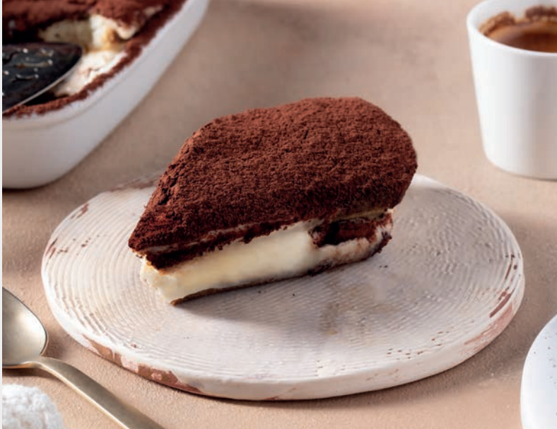
Damla Sakızlı Tiramisu 900 ₺ Damla sakızlı, Türk kahvesi aromalı tatlı. Gluten, Süt ve Süt ürünleri

1539 yılında Kanuni Sultan Süleymanın oğulları Cibangir ve Beyazıt'ın sünnet düğününde yemek listesinde yer almış özel bir tathirdir.