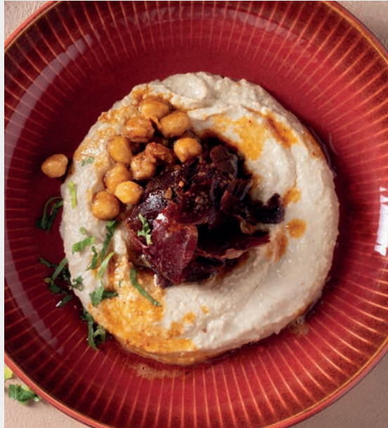
Tereyağlı Pastırmalı Sıcak Humus 1.300 ₺ Nohut, tahin, tereyağı, pastırma Susam Tohumu, Gluten, Süt ve Süt Ürünleri