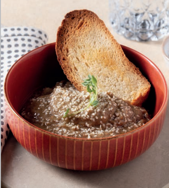
Babaganuş (yoğurtsuz) 460 ₺

Közlenmiş patlıcan, limon suyu, sarımsak. Süt ve Ürünleri (Süzme Yoğurt)