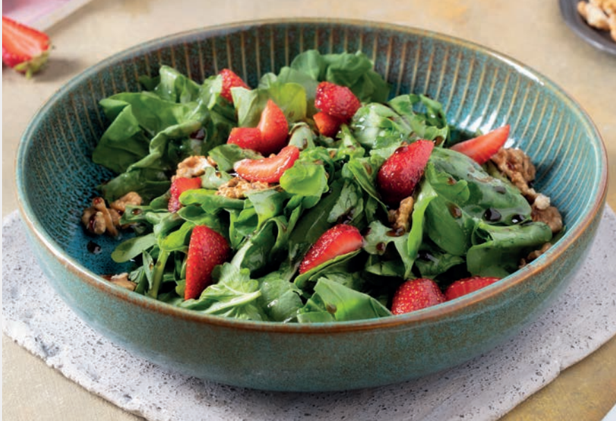
Cevizli Nar Taneli Roka Salatası 860 ₺

Roka, kinoa, avokado, zeytinyağı, balzamik sirkesi