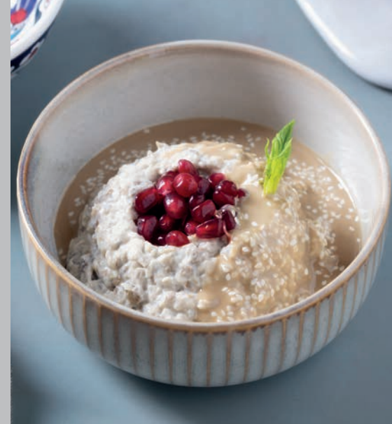
Mutabbal 450 ₺

Kırmızı biber, soğan, sarımsak, salatalık, biber salçası, zeytinyağı ve baharatlarla tatlandırılmış ezme.