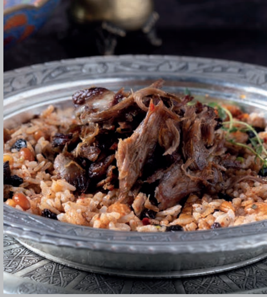
Kuzu Tandır 2.300 ₺

Taş fırında geleneksel yöntemle pişirilen baharatlı pilavlı kuzu eti. Süt ve Süt Ürünleri (Tereyağı), Gluten 220 gr.