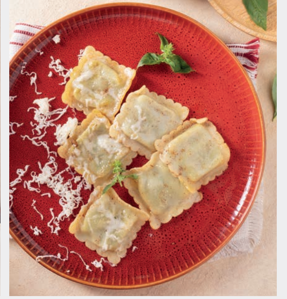
Ispanaklı Beyaz Peyirli Ravioli 980 ₺ Gluten, Süt ve ürünleri (Peynir)