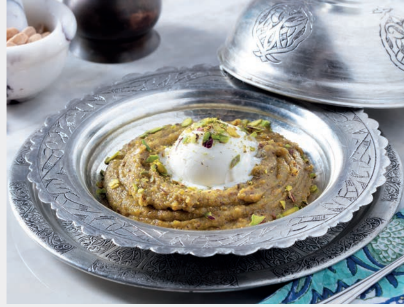
Levzine 900 ₺ Toz badem, tereyağı ve bal ile yapılan badem unu helvasıdır. Sert Kabuklu Meyveler (Badem, Antep Fıstığı), Süt ve Ürünleri (Tereyağı, Kaymak, Dondurma)

1539 yılında Kanuni Sultan Süleymanın oğulları Cibangir ve Beyazıt'ın sünnet düğününde yemek listesinde yer almış özel bir tathirdir.