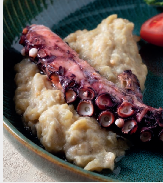
Beğendili Ahtapot Izgara 1.850 ₺ Patlıcan beğendi, maskolin ve ızgara ahtapot ile servis edilir. Yumuşakça, Gluten (Un), Süt ve ürünleri (Tereyağı, Süt) 180 gr.