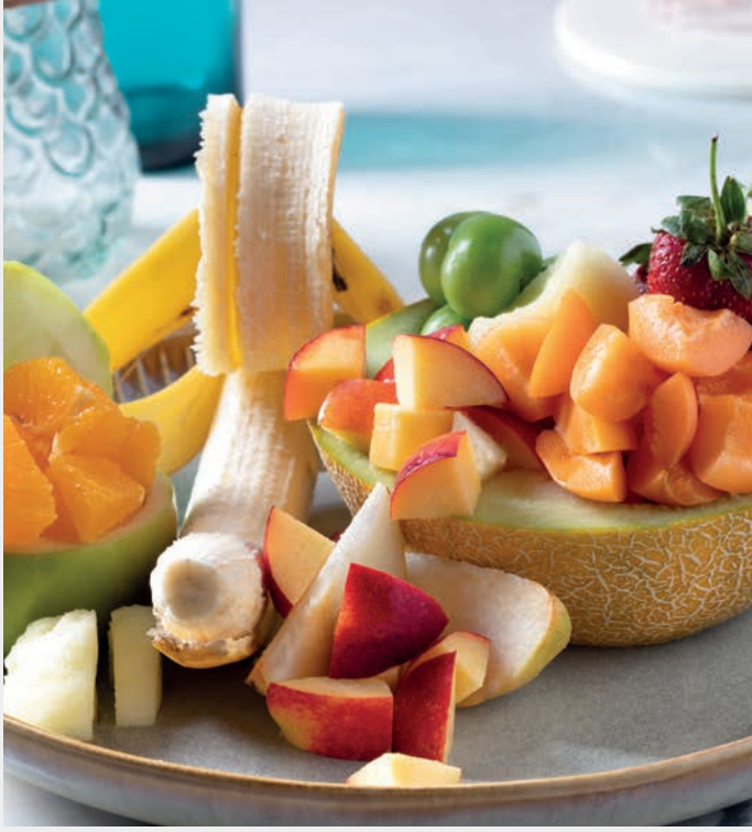
Meyve Tabağı 1.100 ₺ Mevsim Meyveleri