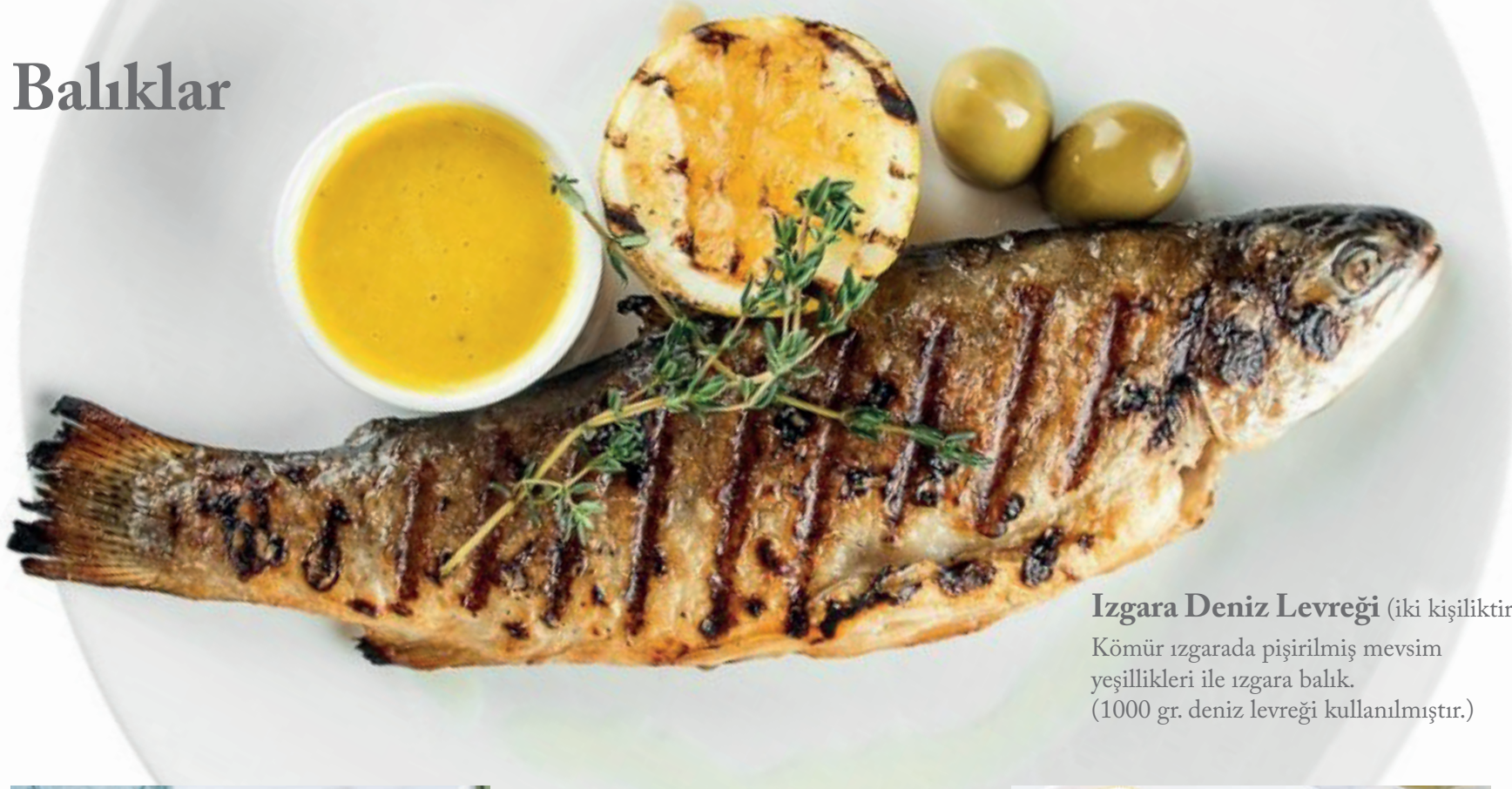
Izgara Deniz Levreği (iki kişiliktir) 6.250 ₺

Kömür ızgarada pişirilmiş mevsim yeşillikleri ile ızgara balık. (1000 gr. deniz levreği kullanılmıştır.)